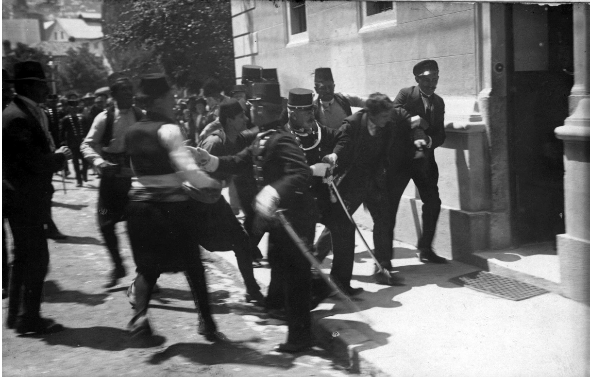
Obrázek 3: Zatčení Gavrilo Principa po Sarajevském atentátu

Všichni atentátníci a jejich komplici byli dopadeni a uvězněni, někteří i popraveni. Gavrilo Princip byl odsouzen na 20 let, ovšem již 28. dubna 1918 zemřel v Terezíně na tuberkulózu.