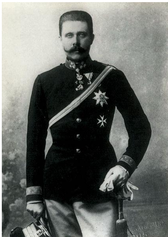
Obrázek 5: František Ferdinand d'Este

https://commons.wikimedia.org/wiki/File:Gavrilo_Princip_cropped.jpg?uselang=cs