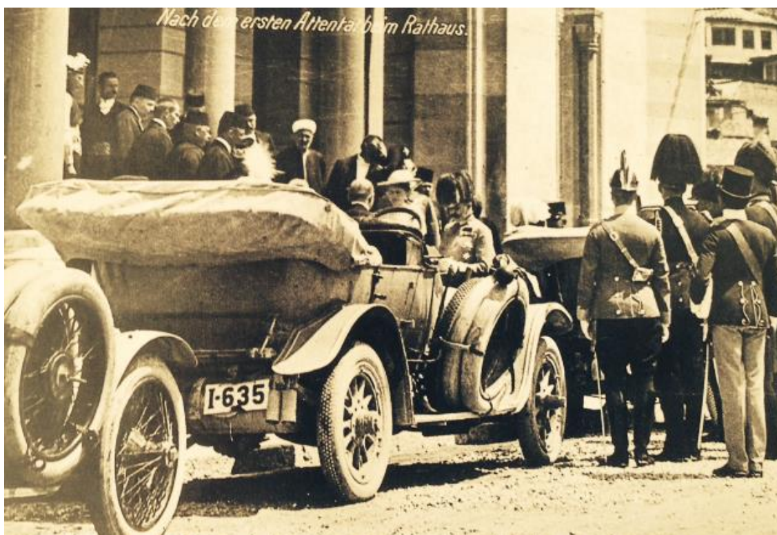
Obrázek 2: Ferdinand d'Este, před Sarajevskou radnicí po prvním atentátu Des Kaisers Rock im 1. Weltkrieg

Na cestě k radnici čekalo hned několik atentátníků s bombami. První dva atentátníky minuli bez problému, jelikož se ani jeden neodvážil zaútočit. Až třetí v pořadí Vaso Čubrilović vrhl bombu na vůz Ferdinanda d'Este, ta se ovšem odrazila od zatažené střechy a vybuchla až pod následujícím vozem. Samotný Vaso Čubrilović skočil do nedaleké řeky Miljacky a pokusil se otrávit kyanidem, který ho ovšem nezabil a tak pokus o atentát skončil nezdarem a uvězněním onoho atentátníka.