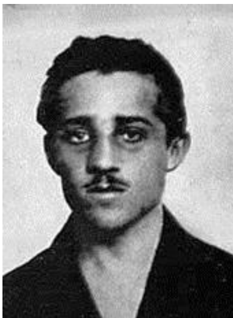
Obrázek 4: Gavrilo Princip

https://commons.wikimedia.org/wiki/File:Gavrilo_Princip_cropped.jpg?uselang=cs