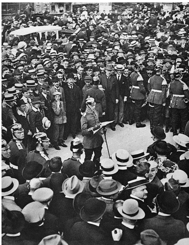
Obrázek 6: Německý důstojník oznamuje vyhlášení války

Německo se na válečný konflikt horlivě připravovalo, již několik let. Císařská armáda předčila ostatní armády zejména díky špičkovému výcviku, perfektní výzbroji, disciplíně, kvalitnímu důstojnickému sboru a hlavně díky hrdosti a vlastenectví. Mírový stav německé císařské armády činil cca. 840 000 mužů, při mobilizaci se mělo toto číslo vyšplhat na 4 mil. Německá armáda se mohla pyšnit také největší flotilou vzducholodí, které byly ve Velké válce masově nasazovány. Největší slabinou Německa bylo nedostatečně velké námořnictvo, které se početně nemohlo s loďstvem Velké Británie rovnat.