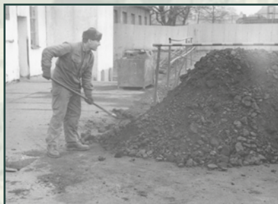
Místo vycvičeného vojáka odešel po dvou letech služby do civilu topič.