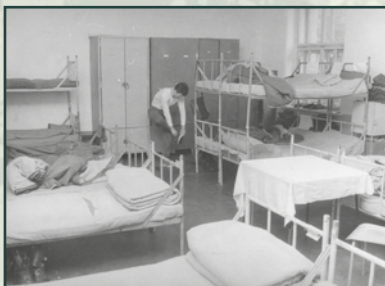
Dva roky života ve stísněných prostorách kasáren