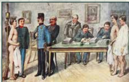
Před odvodní komisí tvořenou zástupci vojenské i civilní správy