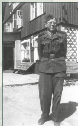
Vojáci technických a pomocných technických praporů odcházeli k výkonu činné služby kromě hlavního nástupního termínu po celý rok podle potřeby.