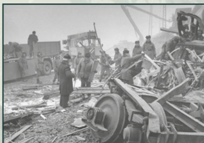
Vojáci oprávněně zasahovali při katastrofách.