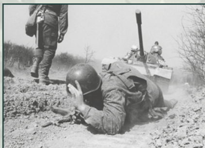
Značná část mimořádných událostí se stala během výcviku.