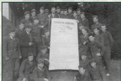
Kromě těžby uhlí byli pětépáci využíváni ve vojenském stavebnictví, např. i při výstavbě rekreačních objektů armády.