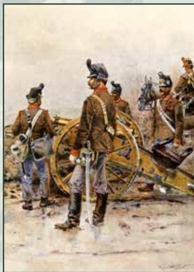
Rakouští polní dělostřelci, polovina 60. let 19. století