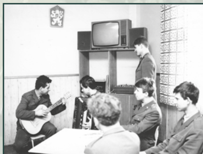
Zájmová umělecká činnost nemusela být nudná. Ve strohém prostředí bylo ale těžké zapomenout na svět kolem sebe.