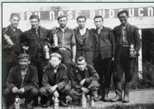
Příslušníci pomocných technických praporů na Ostravsku