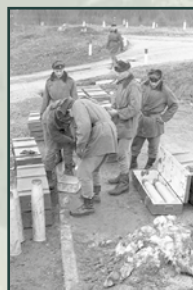
Příprava na ostré střelby