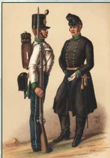
Voják a důstojník olomouckého c. k. řadového pěšího pluku č. 54, 40. léta 19. století