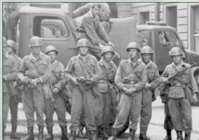
Vojáci základní služby byli nuceni se zapojit i do historicky prvního zákroku proti občanům v srpnu 1969. Naštěstí nikdo z nich pak na rukou krev neměl.

Politický a morální vývoj v armádě po srpnu 1968 kopíroval vývoj zbytku společnosti. Od širokého odporu šel přes drobení postojů a sílící vliv nového politického vedení až po rezignaci. I armáda se takto podrobila. Tento proces svědčí mimo jiné i o sounáležitosti s občany a celou zemí, o vlastenectví i o pozitivním vztahu k hodnotám demokratizačního procesu pražského jara.