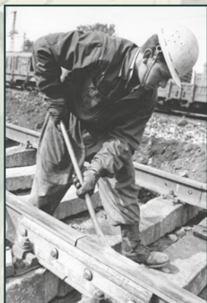
Činnost Železničního vojska bylo možno vysvětlit jeho plánovaným nasazením za války.