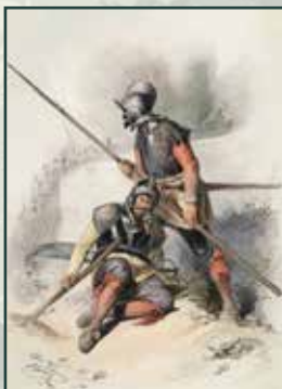
Pěší bojovníci vyzbrojení pikou, tzv. pikenýři, na počátku třicetileté války