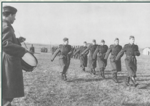
V základním výcviku byla velmi důležitá i pořadová příprava, díky které se voják naučil pochodovat a chodit ve tvaru.