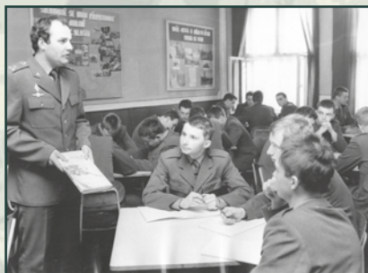
Politické školení mužstva. Skutečně tak vojáci získali ucelené politické vzdělání?