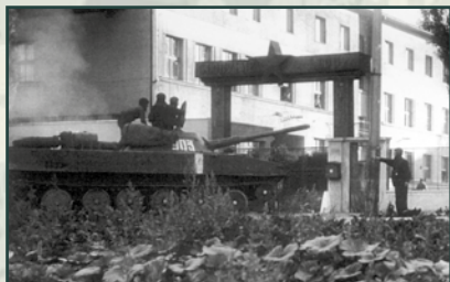
Sovětský tank PT-76 před branou kasáren v Holešově dne 21. srpna 1968