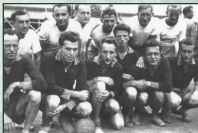
Fotbalové mužstvo lehkého 54. pomocného technického praporu v Lešti