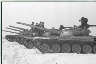
Nedostatek finančních prostředků vedl během 90. let k výraznému omezení výcviku.