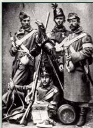
Rakouští pěšáci na snímku z roku 1864