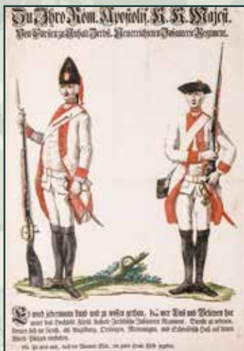
Náborový plakát lákající k dobrovolnému vstupu do řad nově formovaného pluku knížete Fridricha Augusta I. Anhaltsko-Zerbstského, asi z roku 1761. Verbování ve Svaté říši římské znamenalo pro rakouskou armádu vítaný přísun vojáků, protože šetřilo poddané ve vlastních zemích.