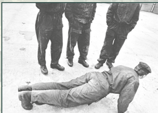
Vojáci druhého ročníku si v zájmu údajného výcviku přisvojovali práva, která jim nepatřila.