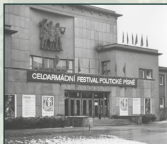
ASUT v Ostravě-Porubě v roce 1978