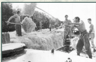
Bez pomoci vojáků při každoročních pracovních výpomocích by se zemědělci asi neobešli.