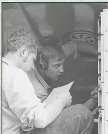
Některé vojenské útvary poskytly své radiokomunikační prostředky pro udržení nezávislého civilního rozhlasového vysílání.