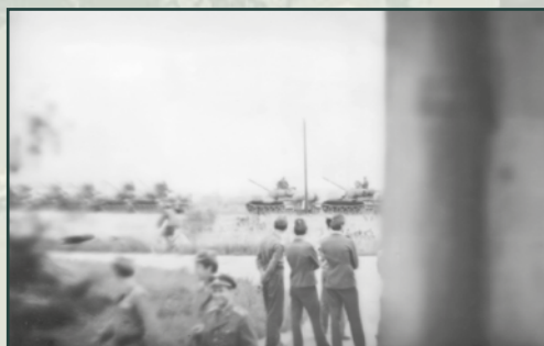
Vojáci základní služby a jejich velitelé bezmocně hledí na polské tanky blokující pardubické vojenské letiště.