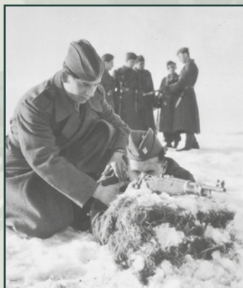
Stejně důležitá byla také střelecká příprava, jež probíhala pod dohledem příslušných velitelů družstev (tzv. věděček) nebo velitelů čet.