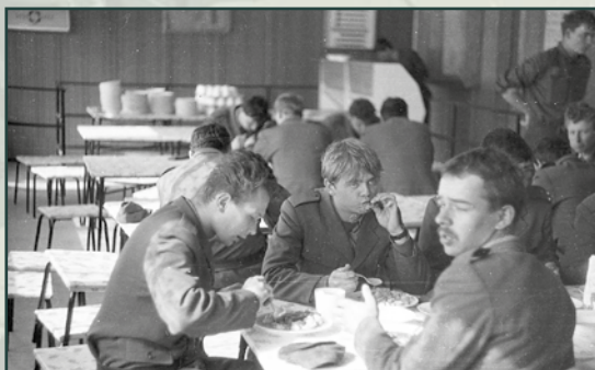
Stravování vojáků druhého ročníku bývalo neformální.