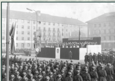
Navenek se zdála být armáda pevnou oporou režimu.