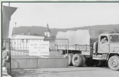
Jednou z forem odporu bylo zablokování vjezdu do areálu kasáren.