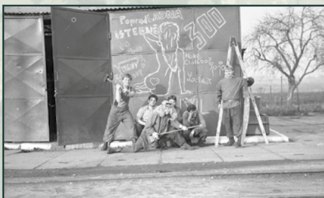
Oslava dosažení tří set dní do civilu u odloučené jednotky Železničního vojska