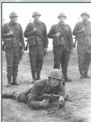
Hranice mezi oprávněnou náročností a šikanou byla někdy nezřetelná.