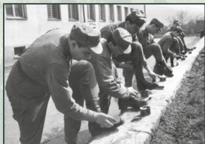
Každodennost vojenské služby