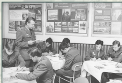
Nástrojem indoktrinace mělo být známé PŠM – politické školení mužstva.