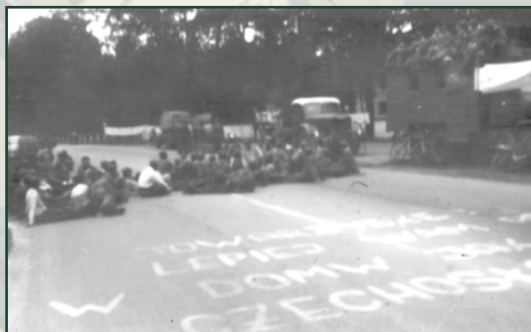
Další formou bylo blokování silniční sítě a marné rozmluvy a vysvětlování s okupanty.