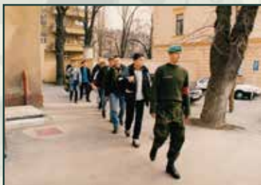
Nováčky. Dne 30. března 2004 nastoupilo základní vojenskou službu v České republice posledních 878 povolanců.