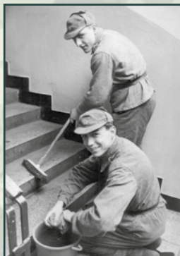
Veškeré nepopulární práce vykonávali vojáci prvního ročníku.