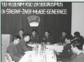
V Socialistickém svazu mládeže byly sice organizovány asi tři čtvrtiny vojáků základní služby, ale na úrovni politického stavu to patrně nebylo.