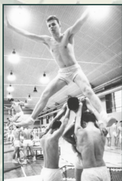
Nácvik na spartakiádu v roce 1985