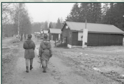
Momentka z vojenského výcvikového prostoru