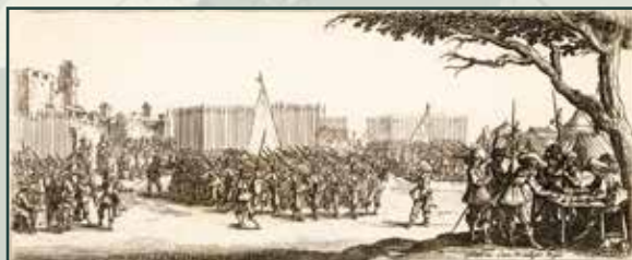
Dobová rytina z časů třicetileté války zachycuje přehlídku zverbovaného vojska.