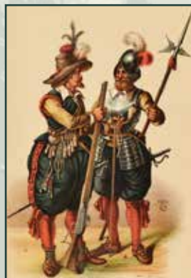
Císařští vojáci z éry třicetileté války na ilustraci z 19. století