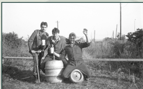
Alkohol byl průvodním jevem neformálních oslav, ale i rizikem pro vznik mimořádných událostí.