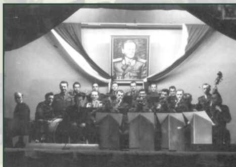
Orchestr III. pomocného technického praporu na Ostravsku