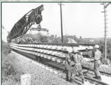
Železniční vojsko vytvářelo při rekonstrukcích tratí za těžkých podmínek nemalé hodnoty.