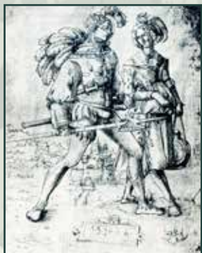
Lancknecht se svou ženou na vyobrazení z roku 1516