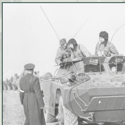
Od začátku 60. let se vojáci ČSLA začali zúčastňovat vícestranných spojeneckých cvičení Varšavské smlouvy.

Vojáci prezenční služby měli v prvních poválečných letech rozličnou výstroj a výzbroj: předválečnou, trofejní a od jednotek vojenského zahraničního odboje.