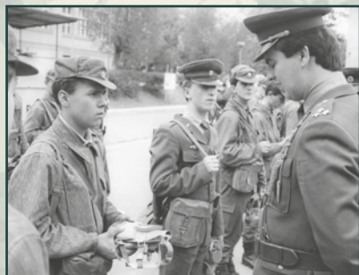
Vojáci toužili přežít vojnu bez problémů.