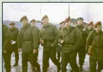
Nasazení vojáků základní služby do zahraničních operací přinášelo mimo jiné legislativní problémy.