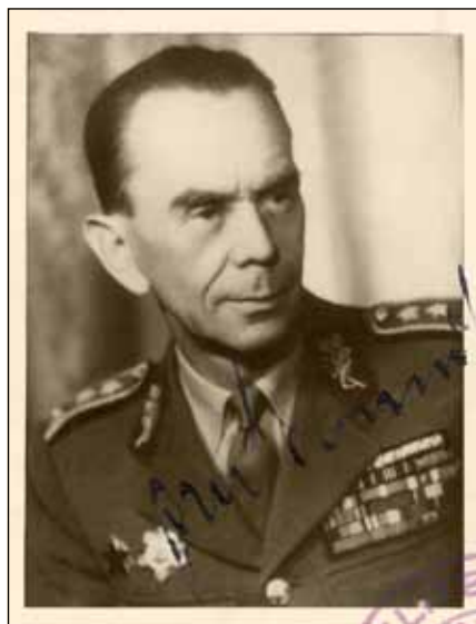
Armádní generál Karel Klapálek na poválečném snímku.

O patnáct let později, v roce 1963, se k této události její hlavní aktér Ludvík Svoboda během historické konference v Liblicích vyjádřil následujícím způsobem: „Když KSČ svolala na pondělí večer do Obecního domu v Praze ustavující schůzi Ústředního akčního výboru Národní fronty, zeptal se mě soudruh Gottwald, s kým jdu. Odpověděl jsem, že to je samozřejmě. Ale já to chci, Ludvíčku, slyšet jasně,“ řekl Klema. Odpověděl jsem: